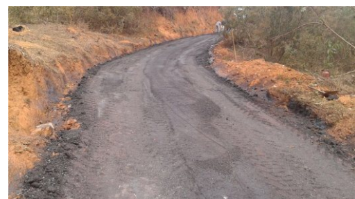
Acesso a localidade do Quilombo

As intervenções melhoram significativamente as condições dos transportes coletivos e escolares, bem como de escoamento da produção, principalmente da Agricultura Familiar.