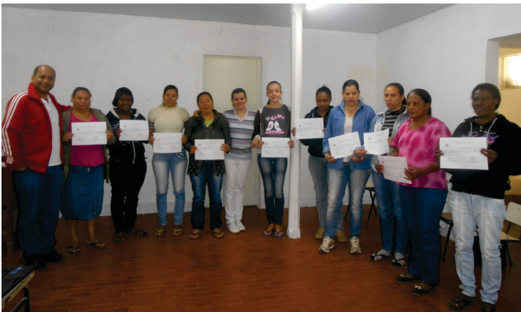
Parte dos participantes do curso de EPI.

Segundo informações da SMS, as palestras tiveram como objetivo proporcionar conhecimento, através de informações importantes, que proporcionam qualidade na produção.