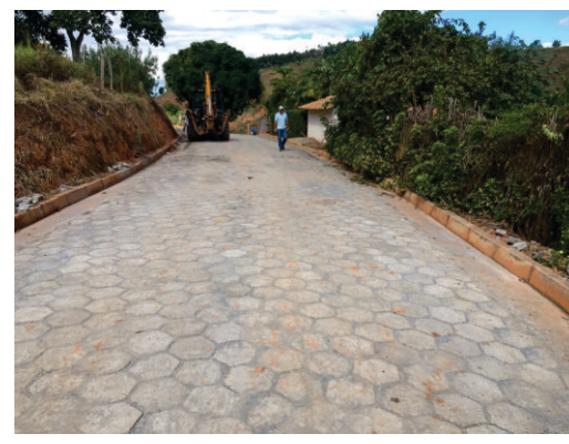
Calçamento em bloquete na comunidade do Jorge