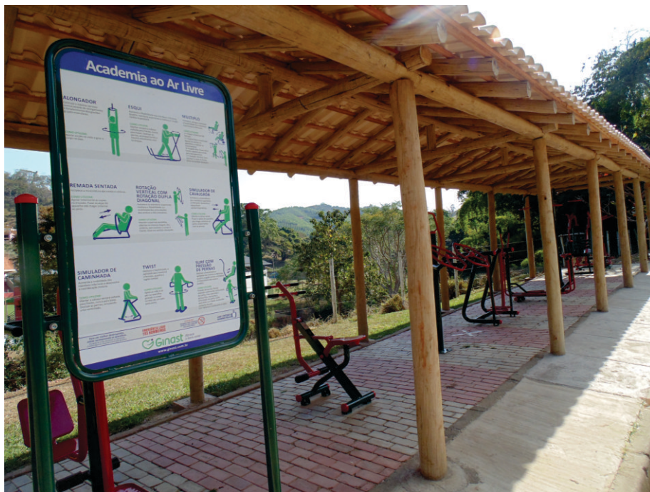
Academia ao Ar Livre na Rua da Linha recebe dezenas de pessoas diariamente

Em breve, outras regiões da cidade também receberão áreas de convivência com equipamentos de Academia ao Ar Livre.