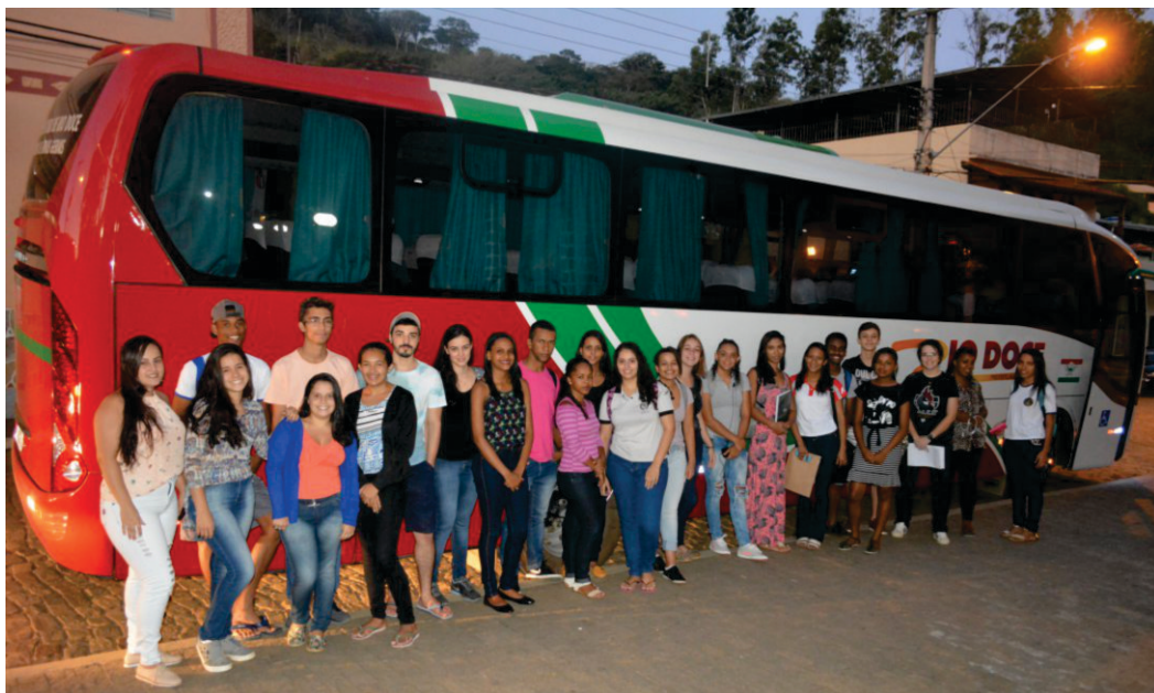
Alguns alunos beneficiados com o programa Bolsa de Estudo e o transporte escolar

transporte escolar em ônibus e micro-ônibus com ar condicionado para a cidade de Ponte Nova.