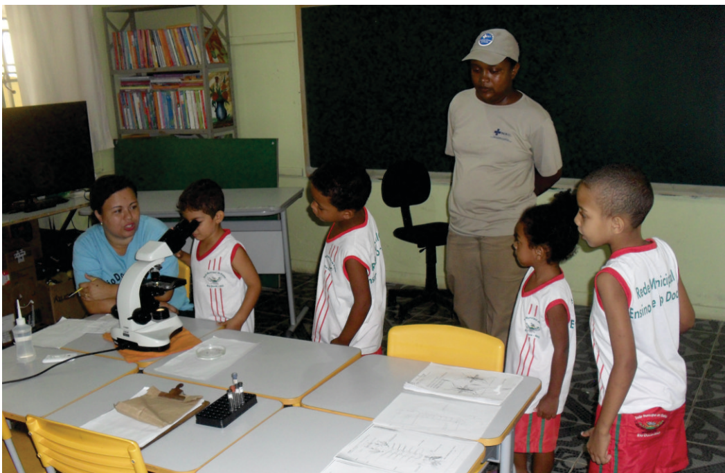
Alunos receberam orientações sobre o ciclo do mosquito Aedes Aegypti

Nas intervenções sobre o combate do mosquito Aedes aegypti , transmissor da dengue, febre chikungunya, febre amarela e zika vírus, a equipe de endemias apresentou o ciclo evolutivo do mosquito, identificação de larvas, métodos de controle, bloqueio de transmissão, programa municipal de combate e orientações sobre a eliminação de criadouros.