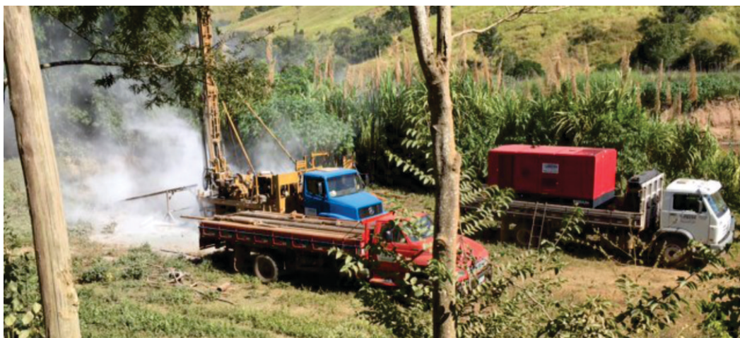
Perfuração de poço artesiano na comunidade de Santana do Deserto

Nessa melhoria foram investidos R$57.869,42 oriundos de convênio firmado entre a Prefeitura de Rio Doce e a Fundação Nacional da Saúde/FUNASA.