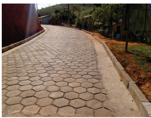
Pavimentação na comunidade da Tapera