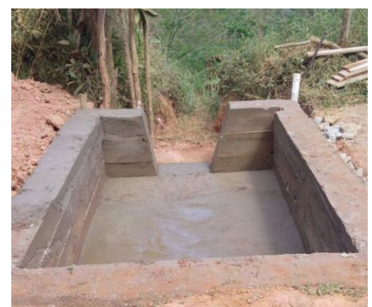
Instalação de mata-burro na estrada de acesso a comunidade do Jorge