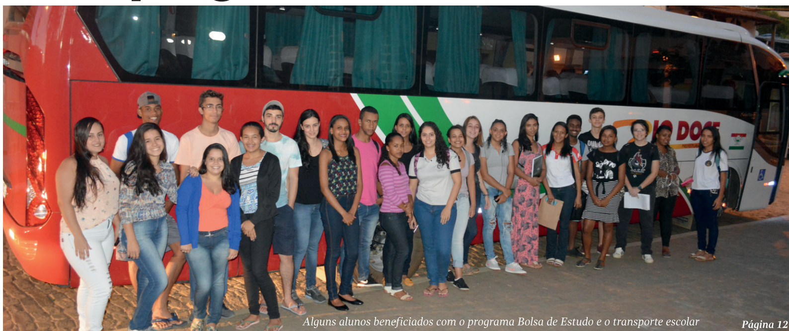
Alguns alunos beneficiados com o programa Bolsa de Estudo e o transporte escolar