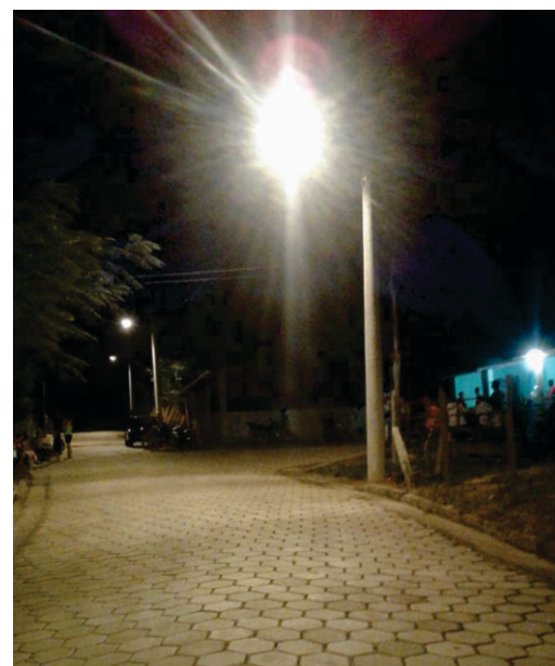
Iluminação pública na comunidade do Matadouro

A modernização do parque de iluminação das comunidades rurais visa garantir uma iluminação mais eficiente e mais conforto e segurança para a população realizar suas atividades rotineiras, como sair à noite, voltar do trabalho ou da escola.