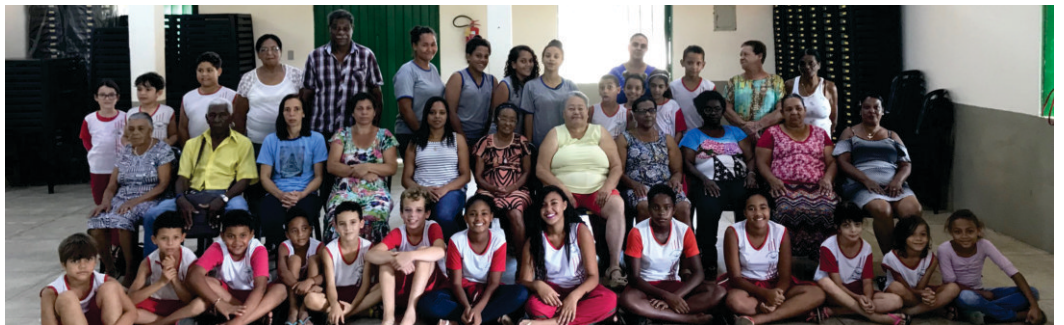
Crianças, jovens, adultos e idosos participam das atividades do CRAS

Com mais de 250 usuários, o CRAS Cláudia Pereira Martins realiza atividades de segunda a sexta-feira, com apresentação de filmes, artesanato, e ações preventivas de convivência, socialização, inserção, acolhida, capacitação, inserção produtiva, apoio e acompanhamento familiar.