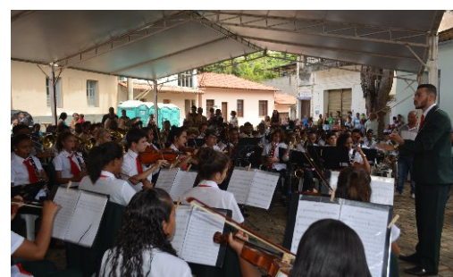
Apresentação da Corporação Musical Santo Antônio

(Visconde do Rio Branco), Sociedade Musical de São Geraldo (São Geraldo), Corporação Musical Sagrado Coração de Jesus (Acaiaca), Corporação Musical 17 de Dezembro (Teixeiras) e a Lira Nossa Senhora do Amparo (Amparo do Serra).