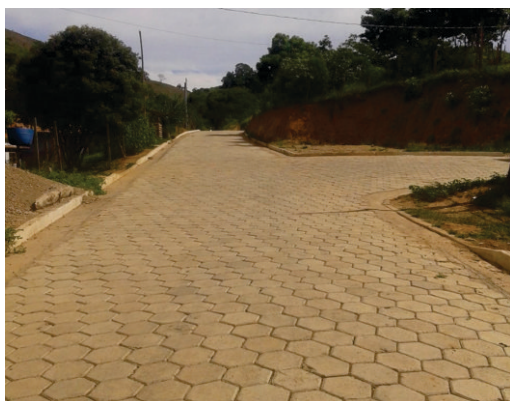
Comunidade do Matadouro também foi beneficiada com melhorias na pavimentação

Com esta ação a Prefeitura de Rio Doce facilita o acesso e contribui para o desenvolvimento econômico e social da região.