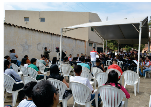
Concerto Didático com a Corporação Musical Santo Antônio

Além do resgate cultural e histórico, a realização da Jornada também é uma etapa importante para Rio Doce, pois certifica o município a receber novos recursos para o setor.